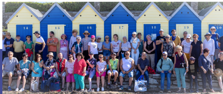
Sortie famille • septembre 2023

Convaincre les parents, ce n'est pas évident, ils ont peur pour nous. Ils doivent nous pousser à prendre notre indépendance.