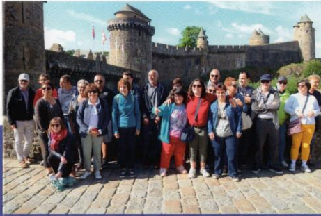
Sortie annuelle Forçages 2019

“ Convaincre les parents, ce n'est pas évident, ils ont peur pour nous. AGIR nous aide à prendre notre indépendance.